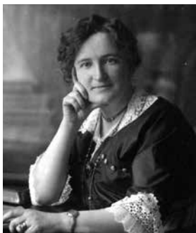
Nellie McClung, activiste pour le droit de vote des femmes et première femme politicienne élue du Canada

Cependant, le système demeure injuste. Les Autochtones, les Canadiennes et Canadiens d'origine chinoise et japonaise ne peuvent toujours pas voter, et ce, même s'ils ont servi dans l'armée. Les Autochtones ne peuvent voter que s'ils cèdent leurs droits issus des traités. De nombreux groupes religieux seront traités injustement pendant des années.