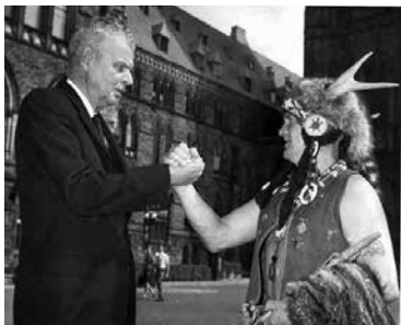
Le premier ministre John Diefenbaker supervisa l'extension du droit de vote aux Autochtones en 1960

Il a fallu de nombreuses années de manifestations et de débats pour atteindre l'égalité. Tous les groupes obtiendront finalement le droit de voter en 1960