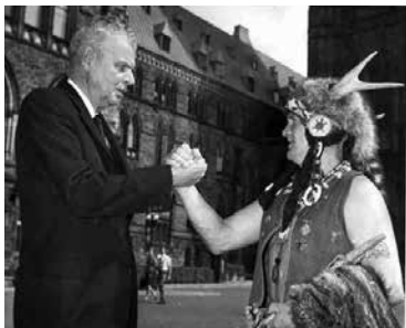
Le premier ministre John Diefenbaker supervise l'extension du droit de vote aux Autochtones en 1960

Cependant, le système demeure injuste. Les Autochtones, les Canadiennes et Canadiens d'origine chinoise et japonaise ne peuvent toujours pas voter, et ce, même s'ils ont servi dans l'armée. Les Autochtones ne peuvent voter que s'ils cèdent leurs droits issus des traités. De nombreux groupes religieux seront traités injustement pendant des années.